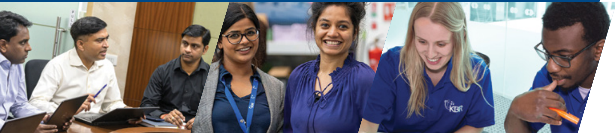
Tabela e përmbajtjes